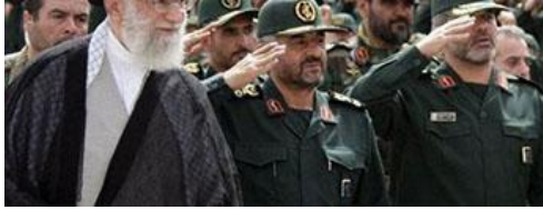
Ali Khamenei, Guide suprême de la Révolution islamique

semble peu à même de valoriser les merveilles historiques et naturelles de ce magnifique pays, pénalisé il est vrai par les tensions internationales, mais elles sont suscitées en partie par l'Iran lui-même. En outre, la grave sécheresse qui sévit depuis plusieurs années a asséché bien des rivières et des cascades. À Pasargades, il n'y a plus de jardin persan. Malgré les siècles et les changements de