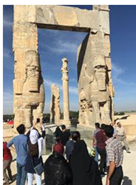
Persépolis.

Peuple semi-nomade de pasteurs et de cavaliers, les Perses n'avaient pas d'architectes. Pour créer un style perse, composite, Cyrus II a fait appel aux artisans anatoliens, assyro-babyloniens, phéniciens et égyptiens pour édifier sa capitale, Pasargades . Elle exprime à la fois la diversité culturelle de l'empire et la force unificatrice de l'empereur. Elle est le premier modèle du jardin persan.