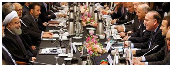
Signature à Paris en janvier 2016 d'accords commerciaux entre l'Iran et la France. À gauche le président Rohani, en face E. Macron, Y. Gattaz, L. Fabius.

Airbus est l'industriel le plus touché. En 2017, il a accepté la commande, par Iran Air et Zagros Airlines , de cent A320-neo, pour 10 milliards de dollars. En outre, l'Organisation iranienne de l'aviation civile estime que 400 à 500 avions iraniens devront être remplacés d'ici dix ans. Or, beaucoup de pièces des Airbus sont fabriquées aux USA. Certains constructeurs automobiles, dont