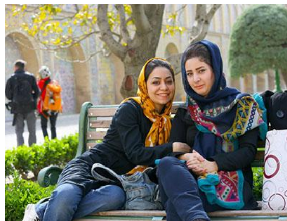
Jeunes femmes de Téhéran

Aujourd'hui, les quatre autres membres permanents du Conseil de sécurité des Nations Unies, l'Allemagne et l'Iran refusent sa demande de renégocier l'accord sur le contrôle du nucléaire iranien. M. Trump veut-il aboutir à un changement de régime en espérant que les difficultés économiques vont favoriser une révolte de la population ? Dans un premier temps, ce sont les modérés au pouvoir à Téhéran qui vont être fragilisés. Les radicaux risquent de s'imposer à nouveau, car ils dominent les forces de répression. L'État contrôle en outre 70% de l'économie.