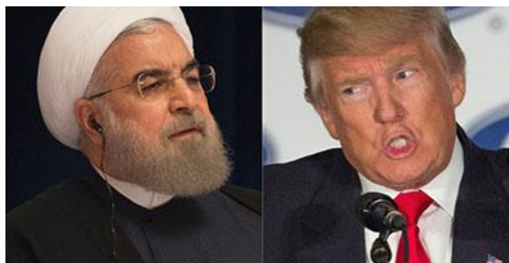
Hassan Rouhani, président de la République islamique d'Iran et Donald Trump, président des USA

pays des parties au traité de 2015 sur le contrôle des activités nucléaires de l'Iran. Le département du Trésor américain va rétablir des sanctions à l'issue de périodes transitoires, qui comptent de 90 à 180 jours. Ces sanctions ne concernent pas que l'Iran et les entreprises américaines. En 2014, la banque BNP Paribas a dû payer une amende de 8,9 milliards de dollar au Trésor américain , pour avoir eu des activités commerciales violant les embargos avec le Soudan ,